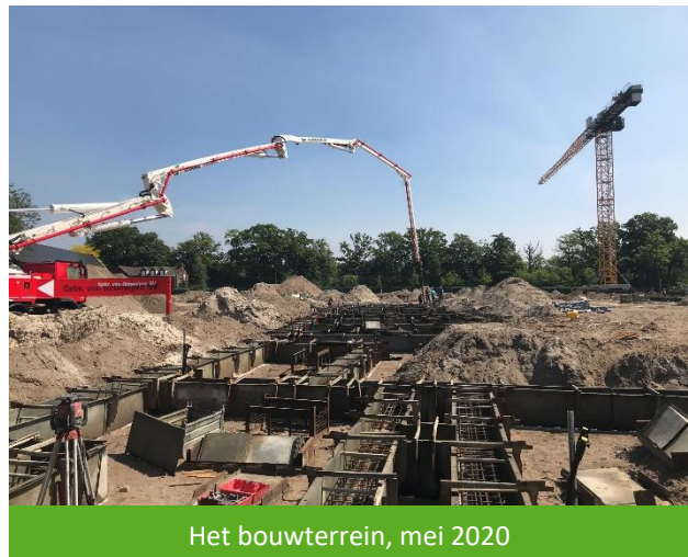
Het bouwterrein, mei 2020

Afgelopen weken is er hard doorgewerkt op de bouwplaats. Er zijn bronleidingen en boorpalen aangebracht en leidingen gelegd. De bouwlocatie ziet er hierdoor een beetje uit als een maanlandschap. Op dit moment wordt hard gewerkt aan de funderingen. De contouren van de verschillende bouwblokken worden nu goed zichtbaar. Verder is er een vaste bouwkraan geïnstalleerd.