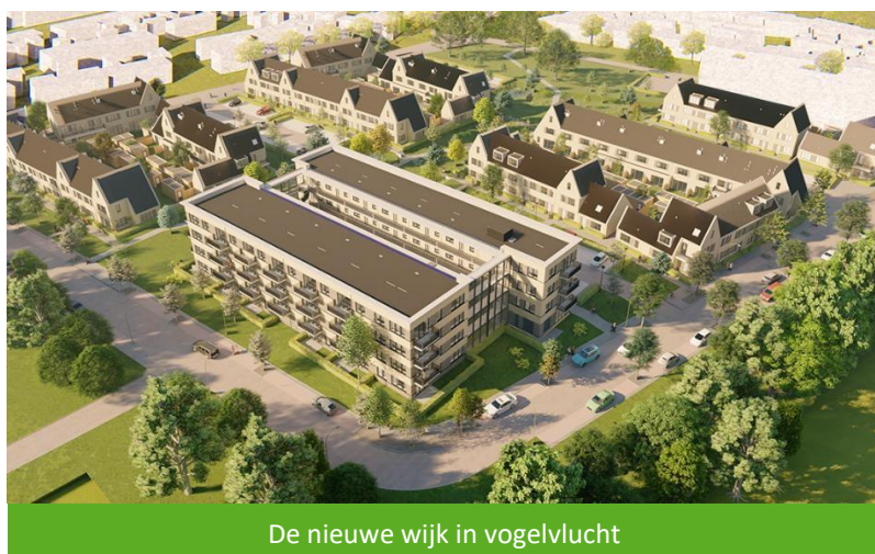
De nieuwe wijk in vogelvlucht