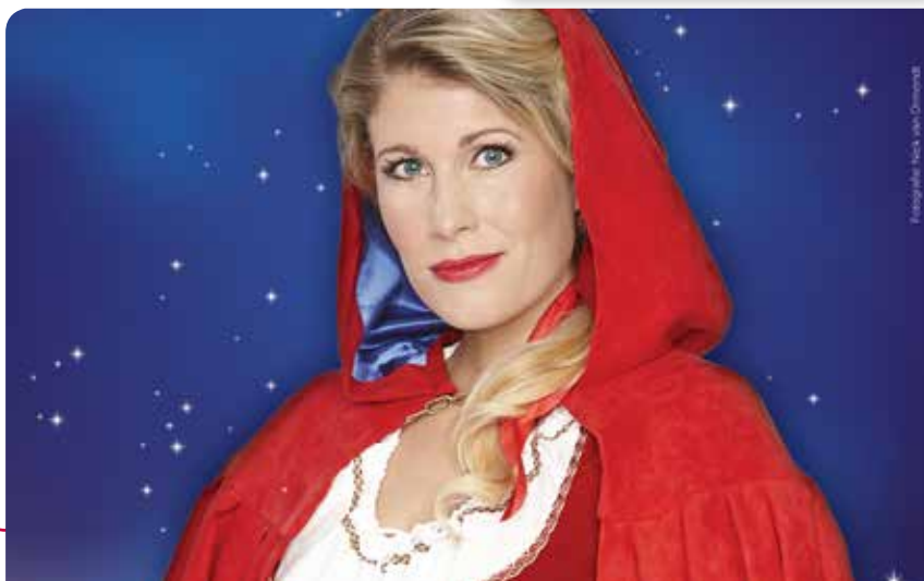
Roodkapje de Musical (4+) is op 7 januari te zien in Theater de Speeldoos

Bij Theater de Speeldoos is het op dinsdagavond filmavond. Op vertoon van uw Woonwijze Voordeelpas betaalt u niet 5 maar 4 euro voor uw toegangskaartje. Voordeelpashouders krijgen ook 5% korting bij aanmelding voor een nieuwe danscursus bij StarsOnStage. Meer informatie op: www.starsonstage.nl